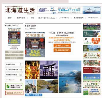
「北海道生活」ホームページ

さらに、「北海道生活」の情報は、インターネットを通して全国や世界へと発信していきます。また、北海道の市町村のエリア情報や、ブログやSNS、メールマガジンなど、“現在の北海道”をリアルに発信することができます。